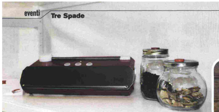
eventi Tre Spade